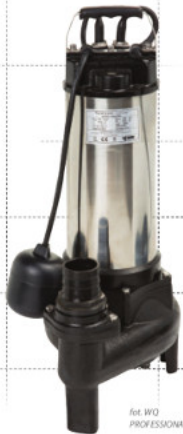
fol. WQ PROFESSIONAL