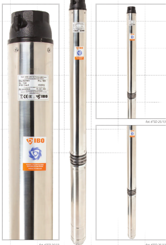
foto. 6SD 25/13