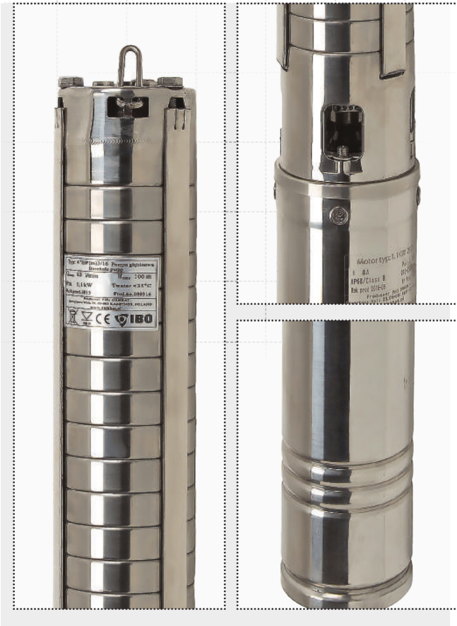
fol. 4''ISP 3/16