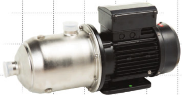
foto: HP1500 INOX